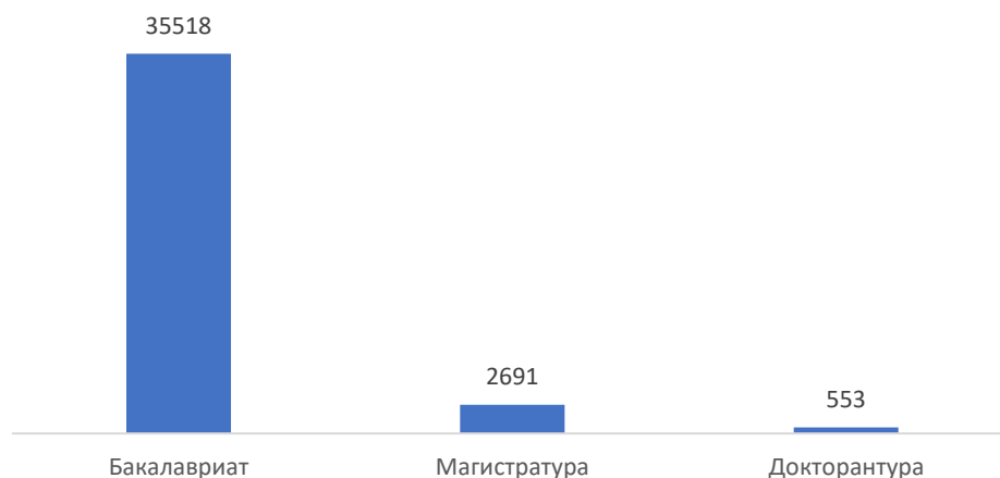
Рис. 3. Количество обучающихся только на англ языке (по уровням образования)

Наибольшее количество обучающихся по всем уровням в вузах - СДУ- 6724 чел., МУИТ – 4976 чел., КБТУ – 4868 чел., Astana IT - 4452 чел., КаНМУ им Асфендиярова – 2822 чел., КИМЭП – 2125 чел., КазНУ им. аль-Фараби - 1798 чел., КазНПУ им. Абая – 1738 чел., Медицинском университете Семей – 1700 чел., ЮКМА – 1377 чел. (Приложение 3).