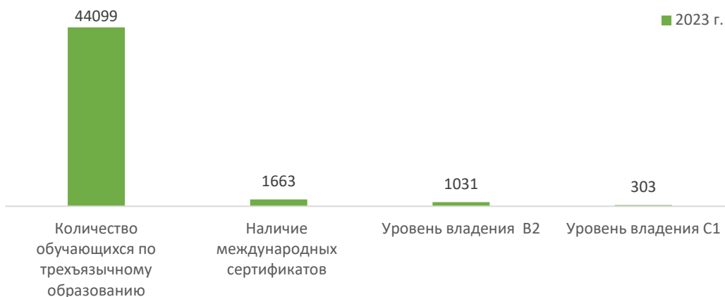
Рис. 1. Количество обучающихся на трехязыках и уровень владения англ. яз., чел.

Количество обучающихся в бакалавриате составляет 38 371 чел., в магистратуре – 4864 чел. в докторантуре – 864 чел. (таб.1, рис.2).