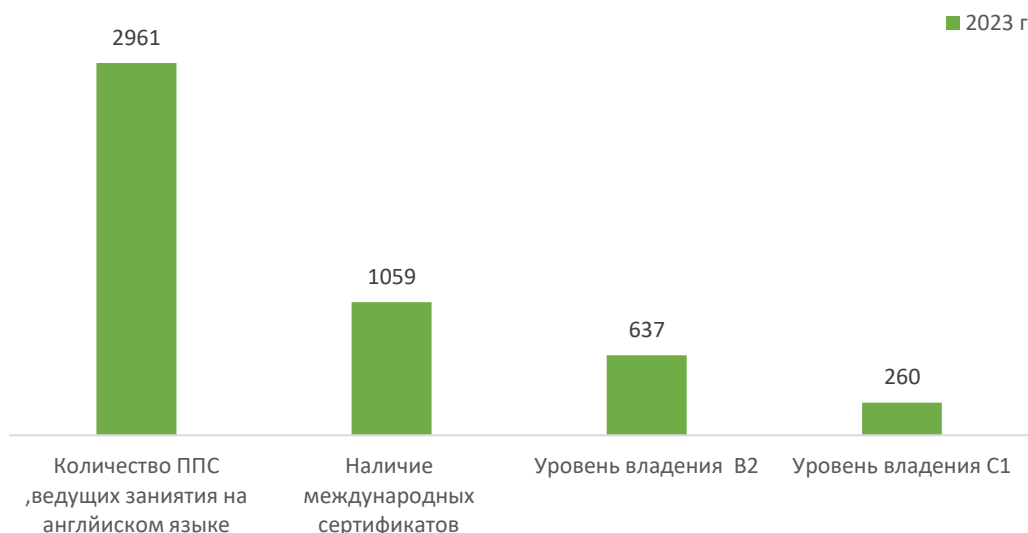
Таблица 3. Количество ППС, преподающих на английском языке по трехязычию и по уровням образования, чел.