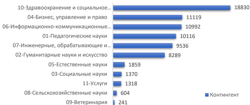
Рис. 6. Направления подготовки в рамках обучения на трех языках и только на английском языке, в разрезе контингента обучающихся, чел.

Итоги мониторинга реализации трехязычного образования показали следующее: в вузах Казахстана имеются некоторые проблемы с внедрением трехязычного образования. Не повышается уровень английского языка обучающихся и ППС. Так, от общего количества обучающихся и ППС, доля количества, имеющих сертификаты IELTS, TOEFL, достаточно низкая - 0.04% и 2% соответственно.