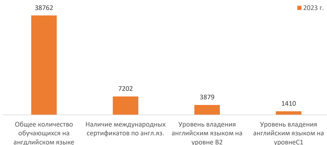
Рис. 4. Количество обучающихся только на англ языке и уровень владения англ.яз.

Анализ по уровням образования закономерно показывает наибольшую долю обучающихся только на английском языке, а также владеющих языком на продвинутом уровне. Так, если в бакалавриате эти цифры составляют 91% и 4,8% соответственно, то на уровне докторантуры 1,4 % и 19,5% . Вместе с тем, тот факт, что для уровня докторантуры