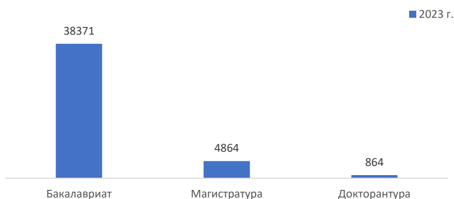
Рис. 2. Количество обучающихся на трехязыках (по уровням образования), чел.