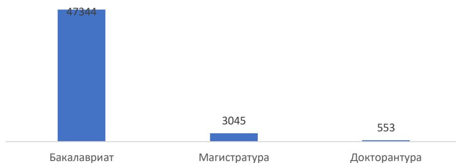
Таблица 2. Количество обучающихся только на англ. языке (по уровням образования)