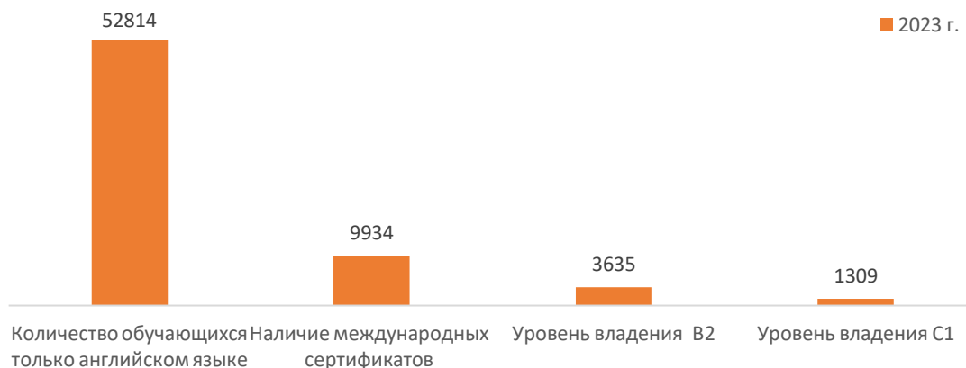
Рис. 4. Количество обучающихся только на англ. языке и уровень владения англ.яз.

Анализ по уровням образования закономерно показывает наибольшую долю обучающихся только на английском языке, а также владеющих языком на продвинутом уровне. Так, если в бакалавриате эти цифры составляют 89% , то на уровне магистратуры 10% . Доля докторантуры составляет 1% . Вместе с тем, тот факт, что для уровня докторантуры только примерно 1 из 5 докторантов владеет английским языком на уровне C1 является показателем низкого качества подготовленности обучающихся в докторантуре.