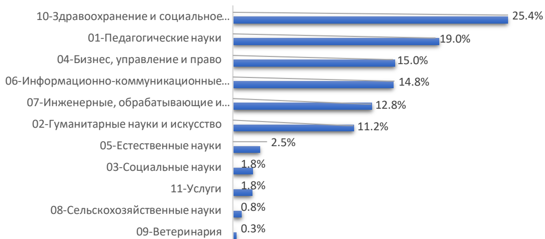
Рис. 6. Направления подготовки в рамках обучения на трех языках и только на английском языке, в разрезе контингента обучающихся, чел.

Наиболее приоритетными направлениями подготовки в рамках обучения на трех языках в вузах РК выступают: 10-Здравоохранение и социальное обеспечение (медицина), 01- Педагогические науки, 04-Бизнес, управление и право, 06-Информационно-коммуникационные технологии (рис.6).