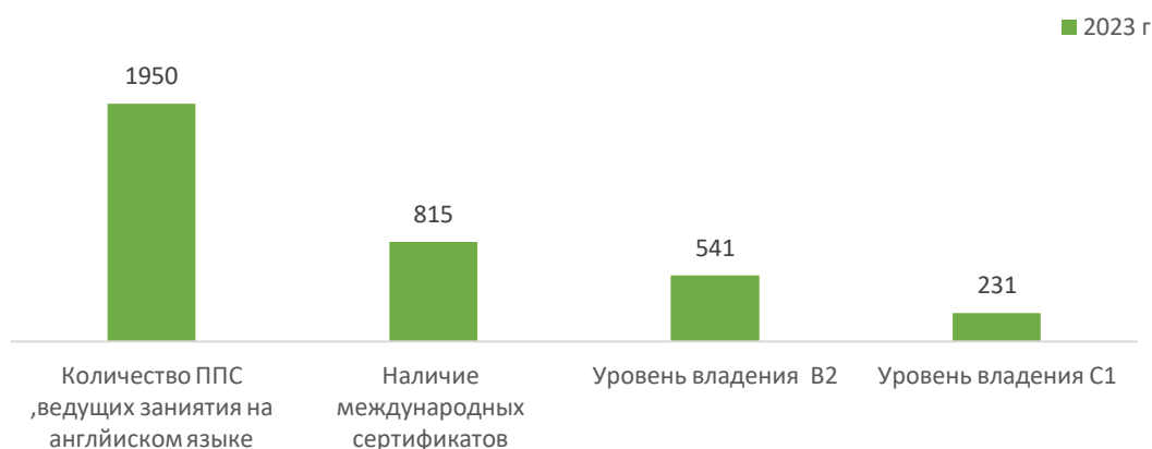
Рис. 3. Количество ППС, ведущих занятия на английском языке и уровень владения англ.яз.

Количество ППС, преподающих только на английском языке - 5636 человек. (2022 г. – 4217). Из них 2573 человека (2022 г. – 1580) имеют сертификаты, подтверждающие уровень владения английским языком, и 1076 человек владеют английским языком на уровне B2 и 860 человек на уровне C1 (табл.3, рис.4).