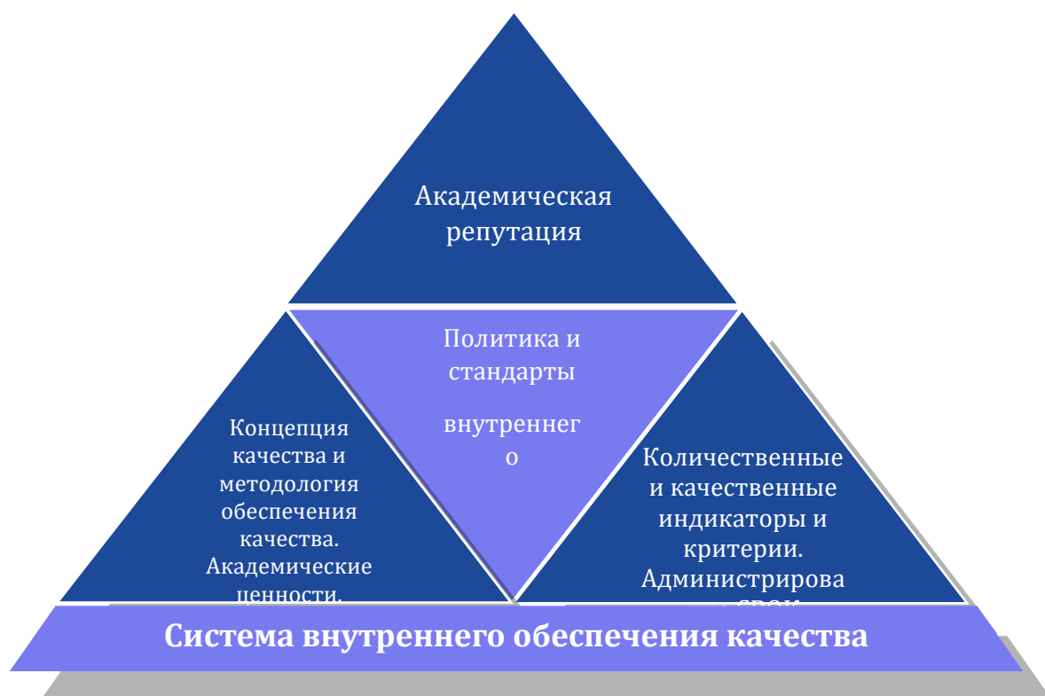
Рис. 2. Модель системы ВОК

Показателем достижения высокого академического качества системы внутреннего обеспечения качества является академическая репутация высшего учебного заведения.