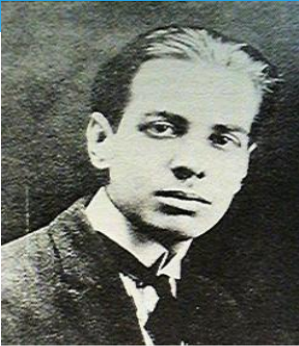
Уилсон Мизнер - американдық драматург, жазушы 19.05. 1876. – 3.04.1933 в.

XX ғасырдың басындағы американдық драматург, жазушы Уилсон Мизнер бір кездері: "сіз бір автордан материал алған кезде, бұл плагиат, бірақ көптеген адамдардан алған кезде бұл зерттеу" деген сөзінің бұл күндегі ақиқаты: «егер сіз бір автордан материал алсаңыз, онда бұл бір сот ісі, егер көптеген адамдардан алсаңыз көптеген сот ісі»