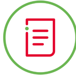
Грамматика и лексика