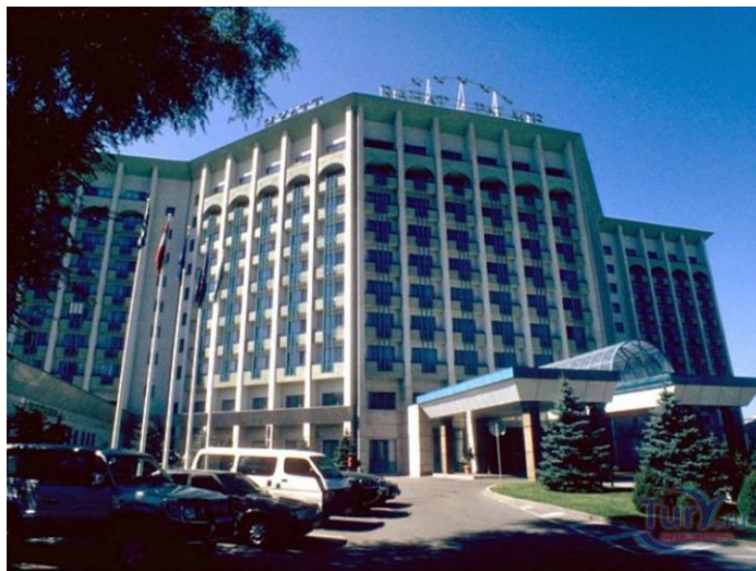
Карта маршрута в гостиницу Rahat Palace